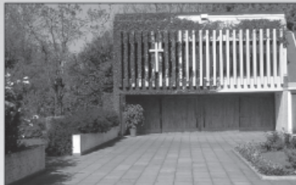
Capilla Pablo Nogués